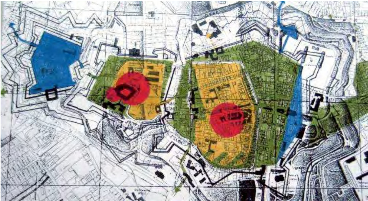
In dieser Reihenfolge ist Wolfenbüttel besiedelt worden: Rot, die ersten Siedlungsstellen waren die mit der Herrenburg, dem Schloss, und auf der Sandbank die Marienkapelle. Dann die gelben Bezirke, die grünen und schließlich die blauen. Darstellung: AG Altstadt Wolfenbüttel, Archiv

Die Stadt Wolfenbüttel wird als erste planmäßig in Deutschland angelegte Stadt in der Renaissance-Zeit angesehen. Dem Stadtgrundriss dieser welfischen Residenz-Metropole ist somit in der Entwicklungsreihe idealtypischer Stadtgrundrisse eine ganz besondere Bedeutung zuzuschreiben. Zum ersten Mal kommt in Deutschland in der Heinrichstadt das konzentrische Prinzip mit der Ausrichtung von drei zum Schlossbezirk/Dammfeste konzentrischen, offenen Hauptachsen für freies Schussfeld in Ost-West-Richtung (es sind dies die Lange Herzog Straße, die Kanzleistraße mit Kornmarkt und die Reichsstraße mit der Harzstraße) und schmalen Querstraßen zur Anwendung. Nicht überall konnte diese Systematik beibehalten werden. Schließlich mussten die Herzöge als Bauherren die örtliche topografischen Verhältnisse und bereits vorhandene Bauwerke berücksichtigen. Eine Vielzahl von Wasserläufen und Gräben durchzog das morastige Tal der Oker. Damit waren einige Festlegungen für die Stadtplaner bereits vorhanden. Auch änderte sich die Planungskonzeption, als Herzog Heinrich Julius die Regierungsgeschäfte von seinem Vater Herzog Julius übernommen hatte. Gleichwohl lässt sich der bis heute erhaltene Stadtgrundriss weitgehend in der Epoche der Hochrenaissance festmachen, also während der Regierungszeiten von Julius und Heinrich Julius von insgesamt 1568 bis 1613.