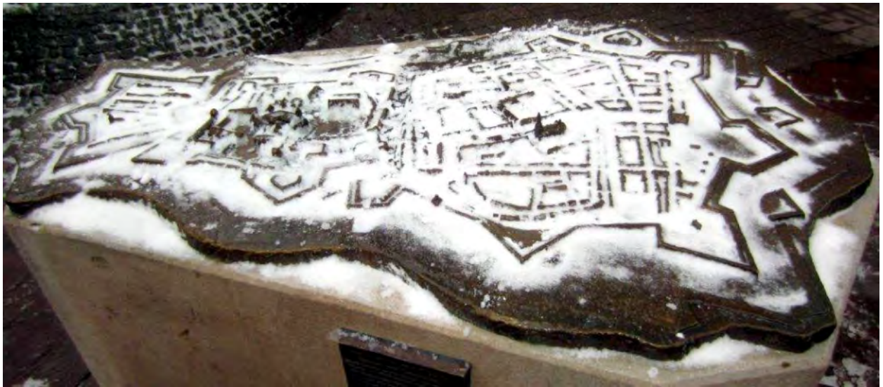
Das Bronze-Relief Wolfenbüttels auf der Langen herzog Straße /Ecke Am Alten Tore trägt einen dünnen Schleier aus Schnee. Die zuerst bebauten Punkte ragen aus dem Schnee heraus: Das Schloss und die Marienkirche.